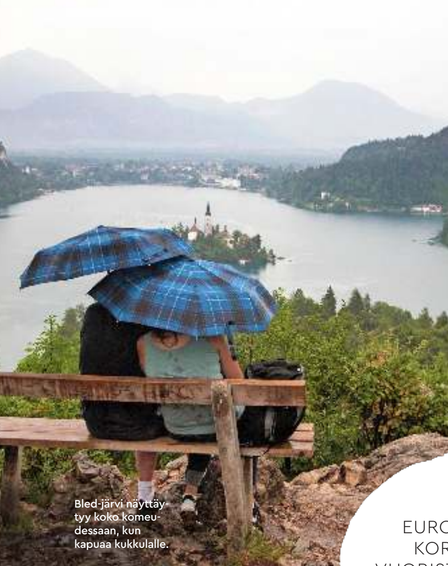
Bled-järvi näyttäytyy koko komeudessaan, kun kapuaa kukkulalle.