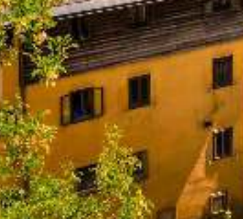
Hallstatt on yksi Itävallan idyllisimmistä kylistä.