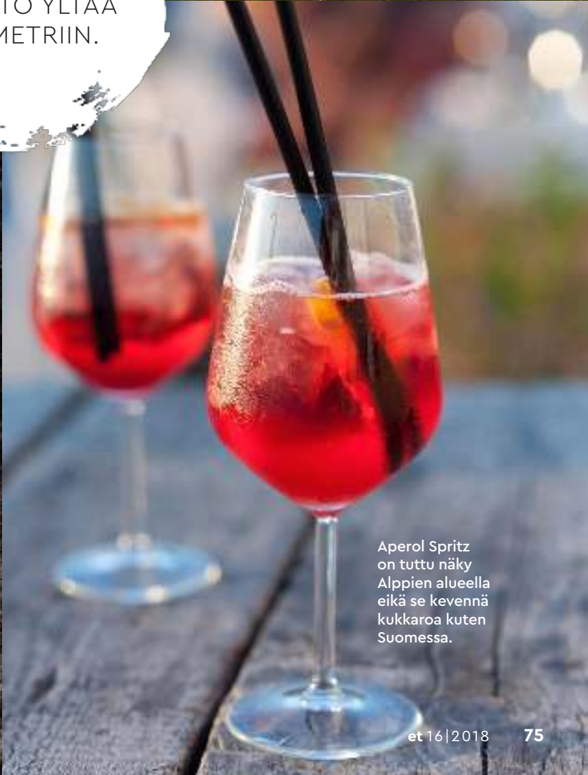
Aperol Spritz on tuttu näky Alppien alueella eikä se kevennä kukkaroa kuten Suomessa.