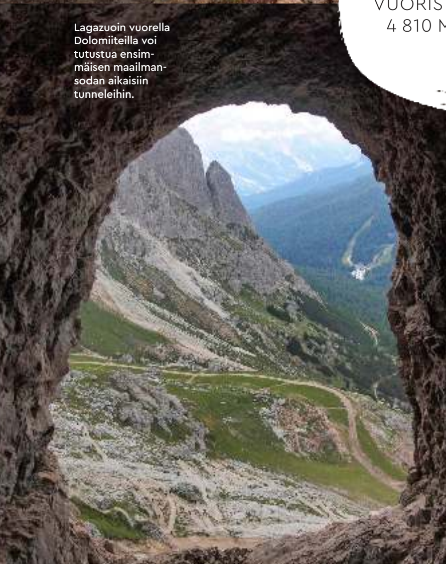
Lagazuoin vuorella Dolomiiteilla voi tutustua ensimmäisen maailmansodan aikaisiin tunnelihin.