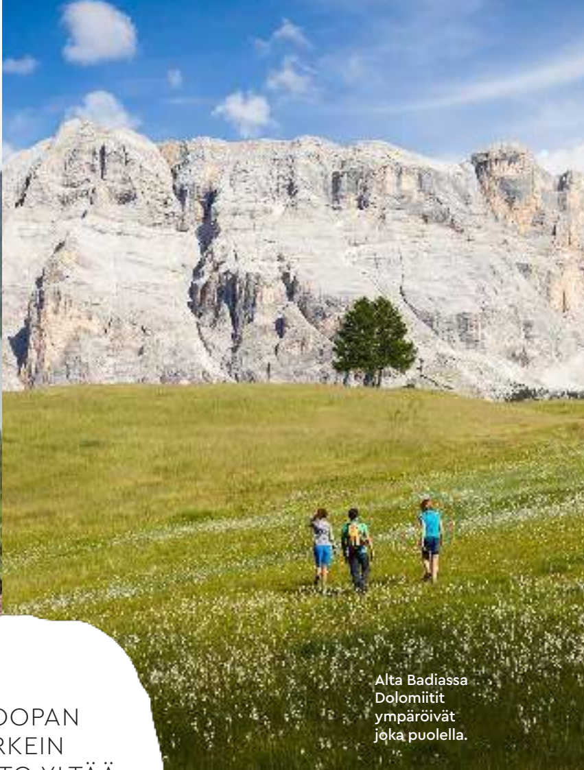
Alta Badiassa Dolomiitit ympäröivät joka puolella.